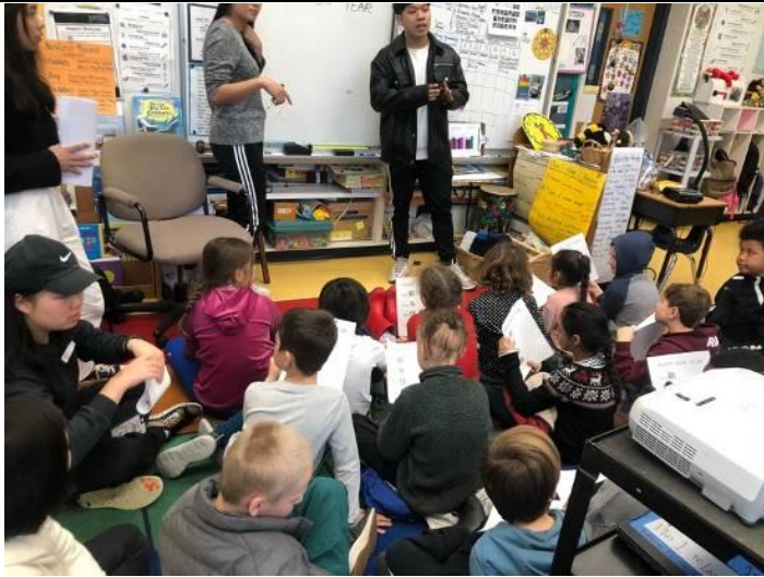
美國小學華語教學活動