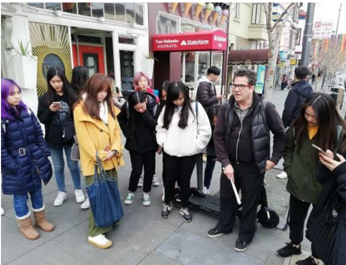
卡斯楚大街文化導覽