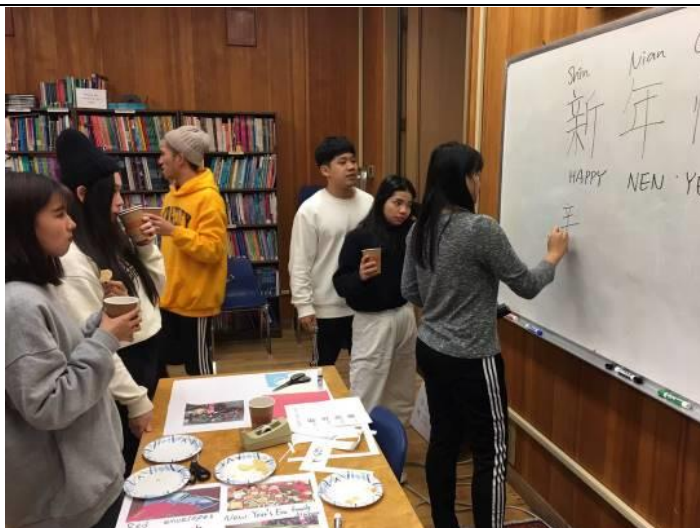
華語課程教案討論