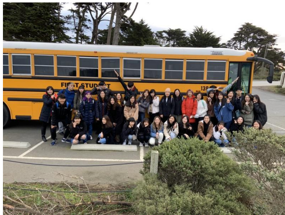
美國傳統校車搭乘體驗