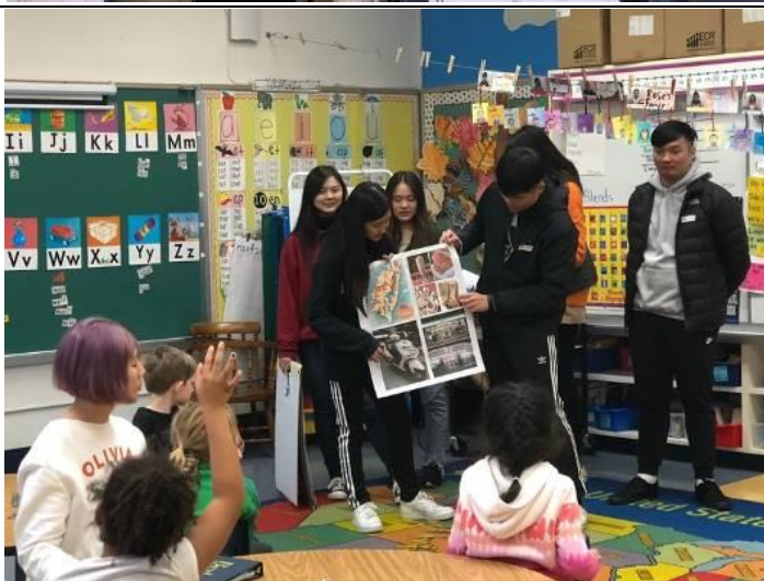
美國小學華語教學活動