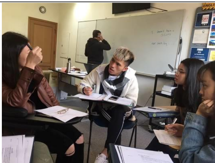
華語課程教案討論

雖然這次的移地學習有些許短暫，我們與 YWCA 的老師們相處時間不多，但也在短時間讓我們體驗到了在地文化。同時也讓我們懂得感恩，感謝帶團老師一人負責三十幾位學生，感謝父母或是自己曾經的努力而來的金錢資助。趁還年輕時要多多抓住這些機會，去體驗、學習並體悟。